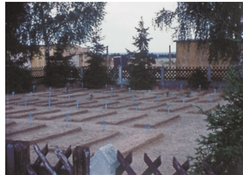
Der Lagerfriedhof