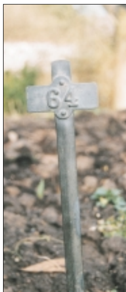
(Heimatmuseum Nieder-Roden) Grabkreuz vom Lagerfriedhof